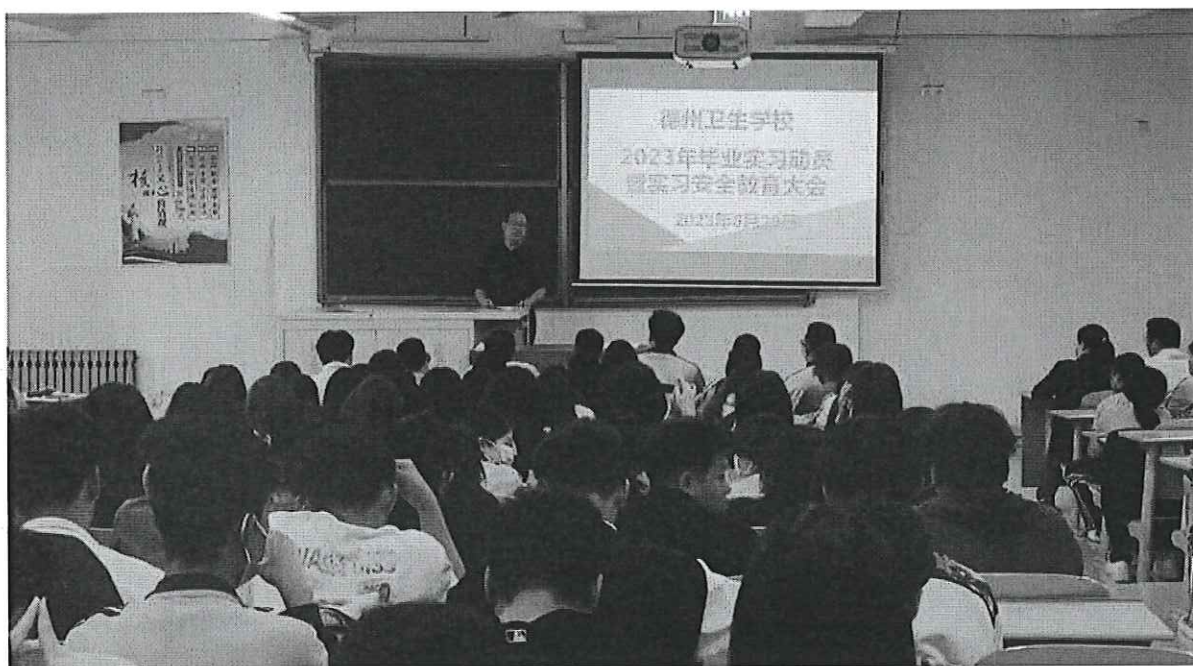
图 2：2023 年毕业实习动员暨安全教育大会

2023 年 5 月 29 日，学校召开 2023 年毕业实习动员暨安全教育大会，对即将参加毕业实习的学生进行实习工作的动员和部署，并开展实习安全教育。