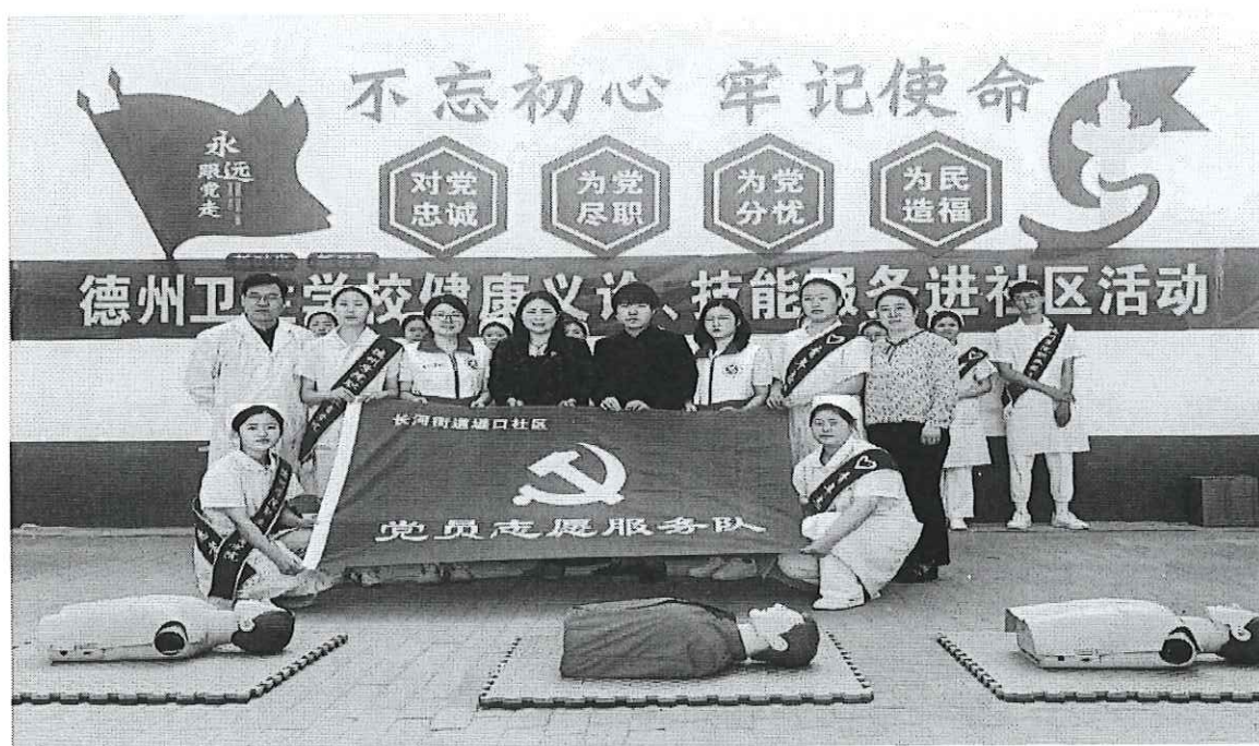
图 1：德州卫生学校志愿者服务队开展社区义诊