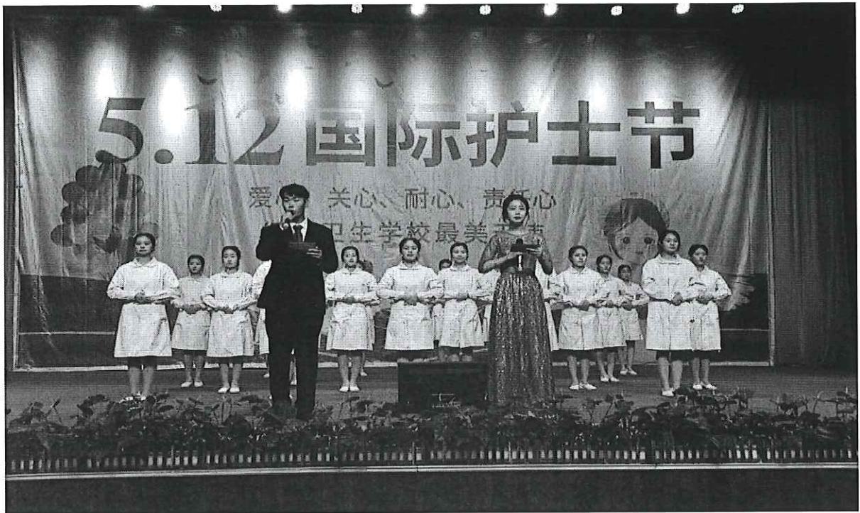
图 3：开展“512”护士礼仪比赛暨授帽仪式

为做好社会主义核心价值观教育，开展班级社会主义核心价值观宣传板比赛，举行践行社会主义核心价值观征文、演讲比赛。开展每班阅览室每周 2 小时固定优秀传统文化书籍阅览时间，举办阅读比赛。开展书法，音乐、美术社团，传承弘扬传统文化。对所有一年级学生开展普通话培训，参加等级考试。开展学风校风建设月活动，传承优良学风、校风。